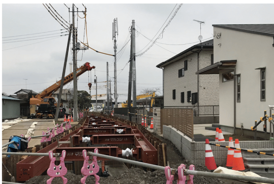
構造物際での施工

GEOTETS工法は、土留め部材を引き抜くことで生じる地中の空隙に専用の恒久グラウト材を同時充填させ、土留め部材を固化したグラウト材に置き換える工法である。軟弱地盤や重要構造物に近接した箇所でも安心して引き抜き、長期にわたり地盤沈下などを抑制する。