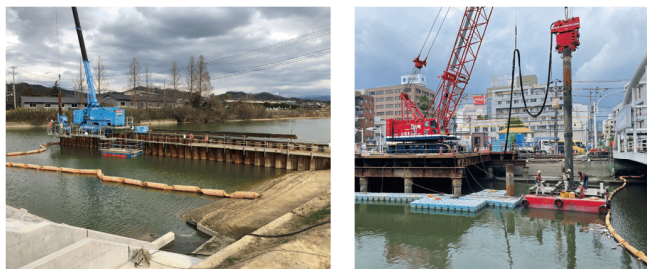
ため池・河川堤防での施工

近年は、大雨による大災害が頻発していることもあり、河川・ため池堤防における土留め工事において、水みちを作らないオンリーワン対策工法として使用実績が増えている。また、水中での施工も可能な方法である。