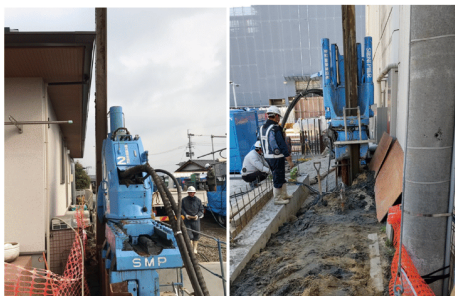
民家際での近接施工

民家などの重要構造物に近接した箇所では、土留材の残置が多いが、本工法では引抜きによって発生する空隙に対して、予め設置しておいた充填管より、引抜きをしながら同時充填する。そのため、地盤変位を高度に抑制し、安心して土留材の引抜きが可能である。