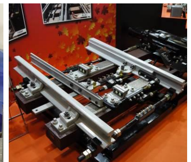
幕張メッセ開催風景（2021年11月）

「鉄道技術展」は、鉄道・交通システムやインフラ技術、施設、電力、輸送、運行管理、車両、インテリア、旅客サービス関連他あらゆる鉄道分野の技術が横断的に会する総合見本市として、2010年より幕張メッセ（千葉県千葉市）にて開催しています。